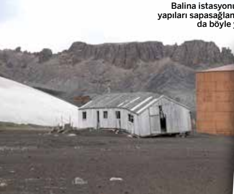
Balina istasyonunun bazı yapıları sapsağlam, bazıları da böyle yarı yıkık.

Bu mevsim penguenlerin doğurma zamanıymış. Yavruların çoğu yumurtadan yeni çıkmış. Kabarık tüylü yavrular nasıl bir dünyaya geldiklerini anlamak ister gibi ürkek ve şaşkın gözlerle çevreyi süzüyorlar. Ayakta duramayacak kadar küçük olanlarsa >>>