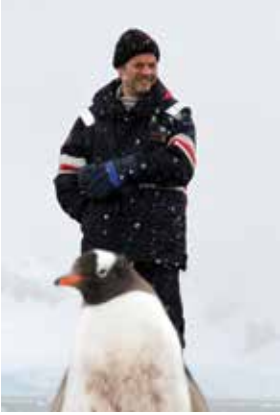
Penguenleri sevmemizin sebebi iki ayakları üzerinde yürüyor olmaları olabilir mi?

Karşımızdaki alçak tepelerin üstü, yamaçlar, aşağıdaki sabile bağlanan geniş düzlük, her yer kımıl kımıl kımıldanan binlerce penguenle kaplı.