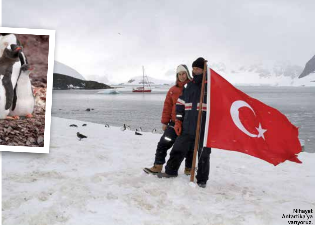
Nihayet Antartika'ya varıyoruz.