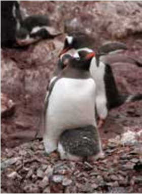
Ürkek yavru penguen, annesinin güvenliğine sığınmış.

Ancak Antarktika'ya gelmeyi göze alan denizciler bu olumsuz koşullardan şikâyetçi değiller. Hatta bunun keşif duygusunun zirveye ulaştığı bir seyir ortamı yarattığını söylüyorlar. Bu denizciler insanlığın hâlâ tam olarak ulaşamadığı, sırlarını bilmediği bir coğrafyada, adeta bir eski zaman kâşifi gibi kendi yollarını kendileri bularak seyretmekten, keşif duygusunu tatmaktan zevk alıyorlar. Daha yolun başında onları anlar gibi oluyor, hatta aynı duyguları, biraz korkuyla karışık olsa da, biz de hissetmeye başlıyoruz. MBY