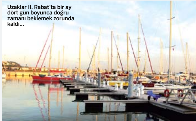
Uzaklar II, Rabat'ta bir ay dört gün boyunca doğru zamanı beklemek zorunda kaldı...

tehlikeli çağrıya kapılanların akıbetlerine dair o kadar çok şey okuduk, liman girişlerindeki kayalıkların üzerinde biten hazin sonlarına dair o kadar çok hikaye dinledik ki. Kendimizi bu tehlikeli çağrının cazibesine kapılmaktan kurtarmayı başarıyoruz. Açıkdeniz selamettir, diye avunarak fırtınamıza geri dönüyoruz. MBY