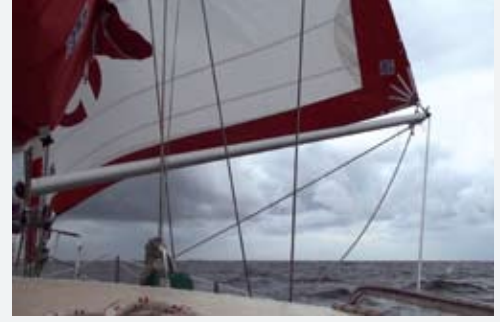
Uzaklar II, seyir sırasında...