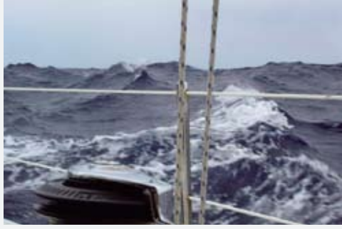
Uzaklar II, hışımla iteleyen fırtınanın önünde...