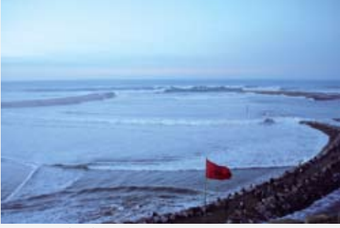
Rabat'tan (Fas) çıkışa izin vermeyen soluğanlar...